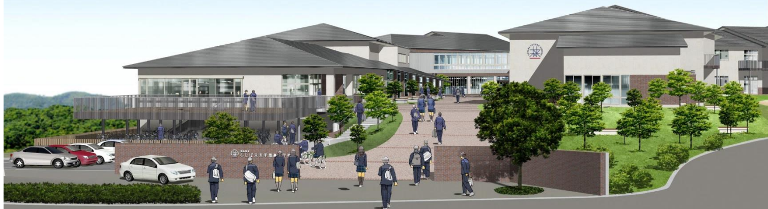
新校舎のイメージ図(平成31年4月完成予定)

未来の中学校でいっしょに学ぼう！ (ふたば未来学園中高一貫教育の特徴ある学びを紹介します。)