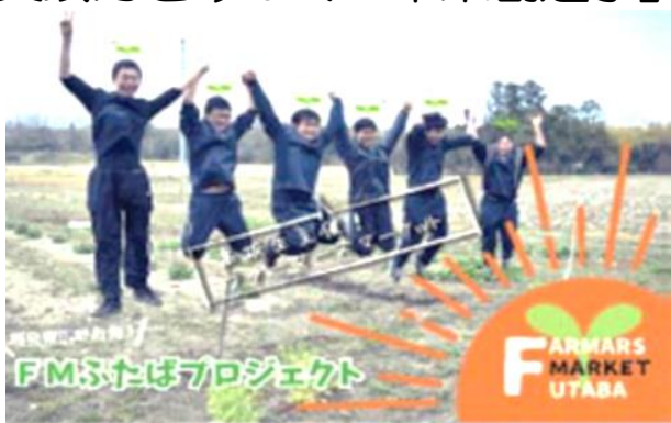
現実社会での課題解決学習

総合的な学習の時間の「未来創造学」では、学校の外に飛び出して実際の社会から学び、課題を解決する力や人と協働する力をみがきます。