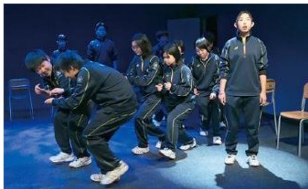
演劇のワークショップ

コミュニケーション力を身につける演劇の授業などで、未来の主人公となるよう、人間性をみがきます。