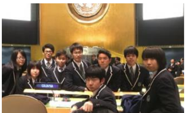
ニューヨーク国連本部における研修

外国人の英語教員と世界の課題について議論したり、プレゼンテーションを行い、実践的な英語力を身につけます。高校では、海外研修において実践している生徒もいます。